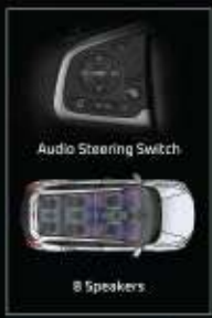
Audio Steering Switch