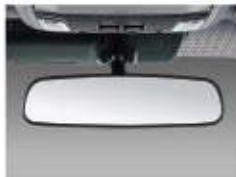
Day/Night Rear-View Mirror