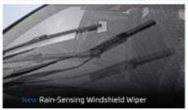
New Rain-Sensing Windshield Wiper