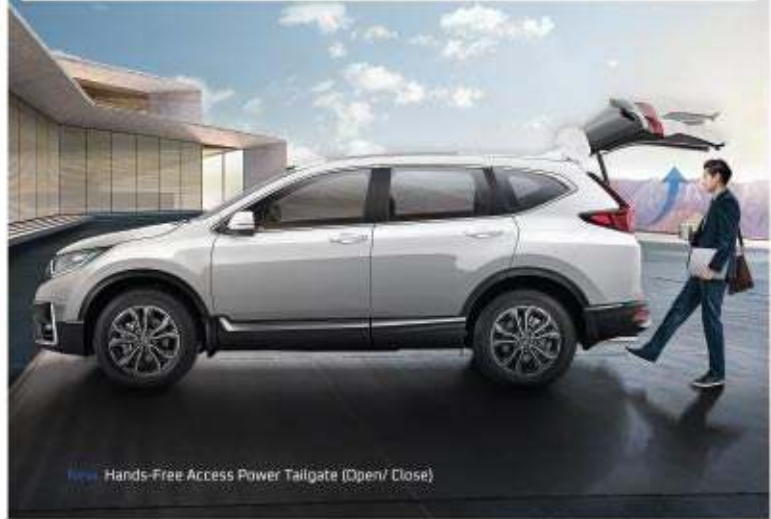
New Hands-Free Access Power Tailgate (Open/ Close)