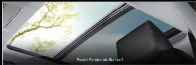
Power Panoramic Sunroof