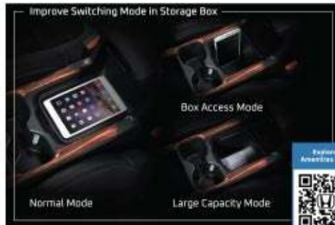
Improve Switching Mode in Storage Box