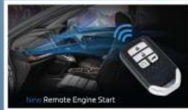
New Remote Engine Start