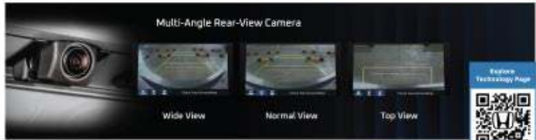
Multi-Angle Rear-View Camera