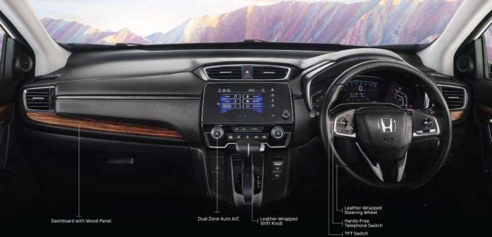
Dashboard with Wood Panel