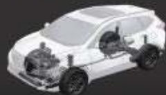
MacPherson Strut & Multi Link Suspension