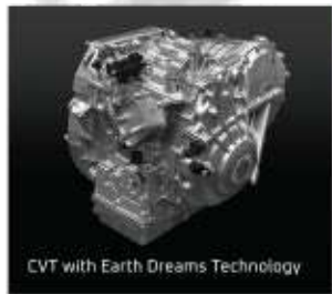
CVT with Earth Dreams Technology

Max Power: | Max Torque: 190PS | 240Nm @5.600rpm | @2.000-5.000rpm